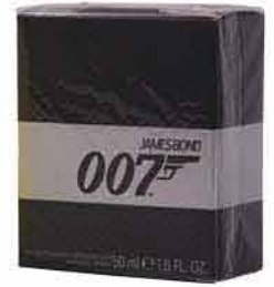
James Bond 007 EDT 30 ml TETA DROGERIE 499,90