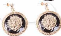
Dámské náušnice CLAIRE'S 199,-