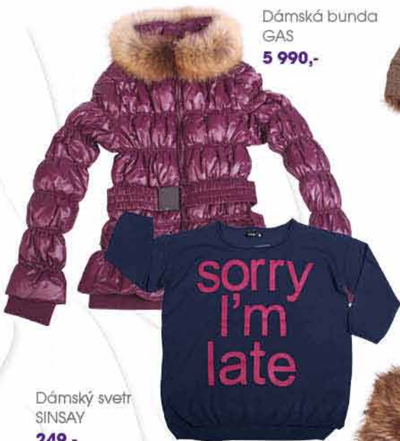
Dámská bunda GAS 5 990,-