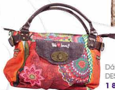
Dámská kabelka DESIGUAL 1 899,-