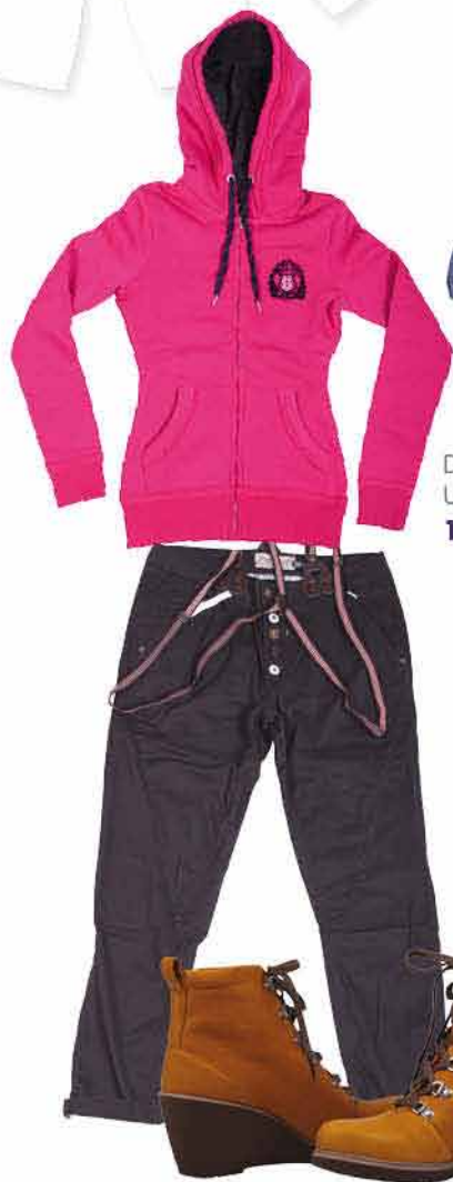
Dámská mlkína UNCS 1 897,-