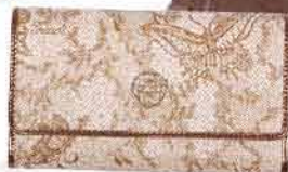
Dámská peněženka GAUDI, GLAM FASHION STORE 1 650,-