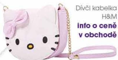
Dívčí kabelka H&M info o ceně v obchodě