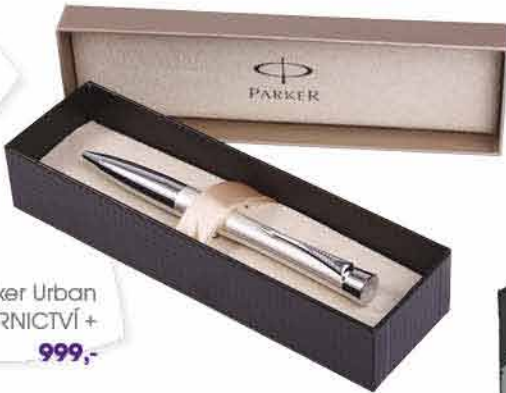
Parker Urban PAPÍRNICTVÍ + 999,-