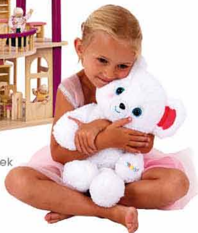
Svítilní medvídek BAMBULE 999,-