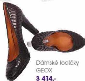
Dámské lodičky GEOX 3 414,-