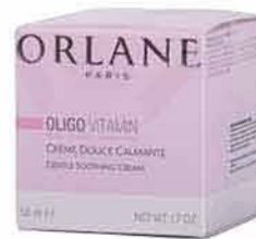
Jemný zklidňující krém ORLANE MARIONNAUD 1 959,-