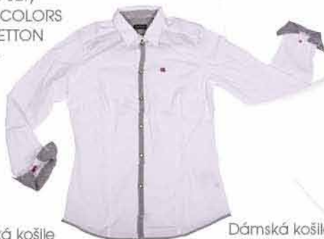
Dámská košile NAPAPIJRI 3 100,-