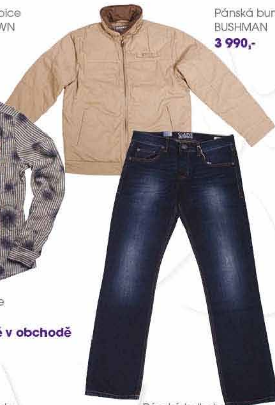
Pánská bunda BUSHMAN 3 990,-