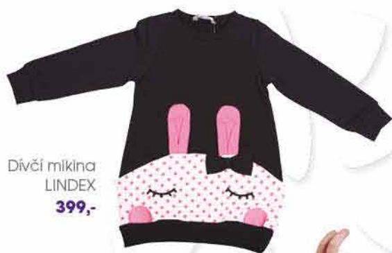
Dívčí mikina LINDEX 399,-