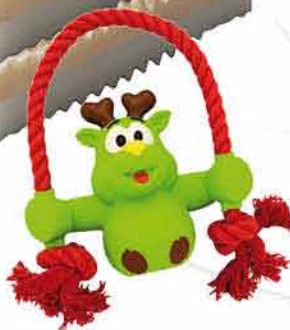
HUHUBAMBOO silikonová hračka PET CENTER 129,-