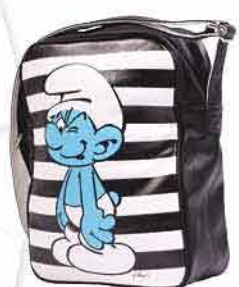
Dětská taška HOUSE 499,-