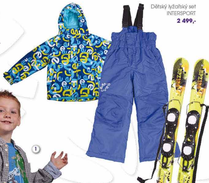
Dětský lyžařský set INTERSPORT 2 499,-