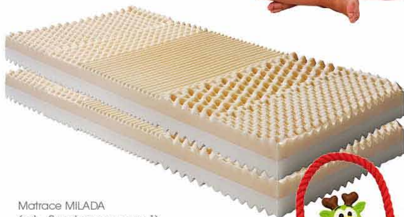
Matrace MILADA (set – 2 matrace za cenu 1) PURTEX 2 499,- / za 1 při nákupu 2 ks