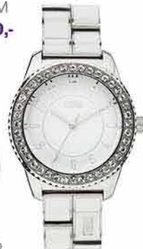
Dámské hodinky NEONA- STORM 4 250,-