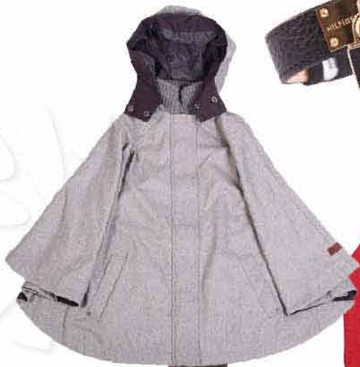
Dámské paleta TIMEOUT 2 499,-

Šedo-červený evergreen. Výrazné kontrasty teplých a studených tónů. Oblíbená kostka a pruhy jsou stále v nejednom šatníku. Doplníte je módním kabátem ve stylu patchwork nebo nechte, ať Vás v zimě zahřívá retro paleta. V módě jsou i svetříky s metalickým vláknem. Blyskněte se v předvánočním čase.