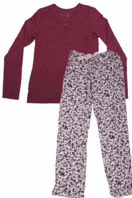
Dámské pyžamo Calvin Klein INTIMMO 2 280,-