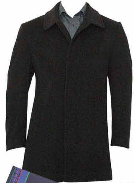
Pánský plášť BHR FASHION 4 490,-