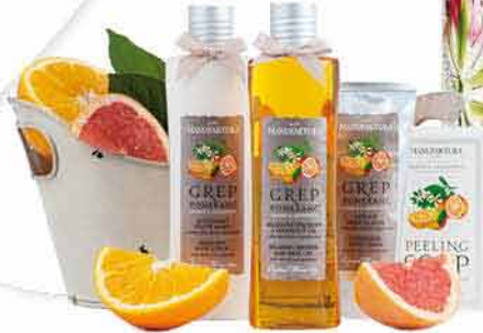
MANUFATURA Limitovaná edice GREP a POMERANČ Vaše voňavá zimní radost...