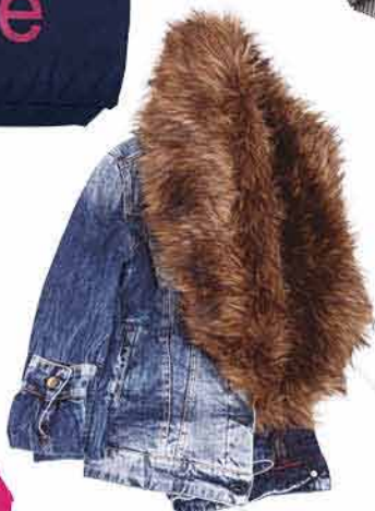
Dámská bunda REPLAY info o ceně v obchodě