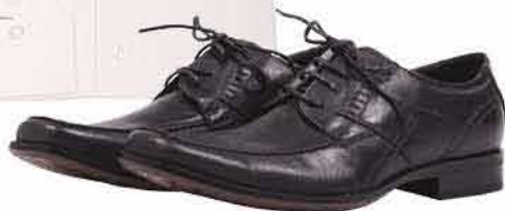
Pánská obuv DEICHMANN 599,-