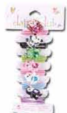
Dívčí gumičky CLAIRE'S 199,-