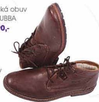
Pánská obuv DR.KUBBA 1 990,-