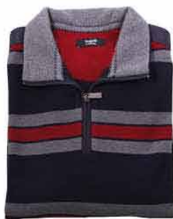
Pánský svetr Bugatti MÓDA NEO 2 990,-