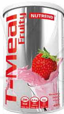
T-Meal Fruity NUTREND 365,-