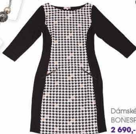
Dámské šaty BONESPRIT 2 690,-