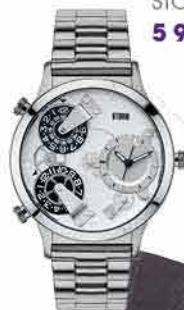
Pánské hodinky TRIOM STORM 5 950,-