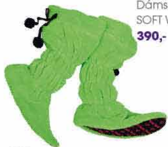
Dámská obuv SOFT WORLD 390,-

Vánoce jsou za dveřmi a Vy stále nevíte, co své drahé polovičce? Žádná žena neodmítne šperk či stylovou kabelku. Prádélko a kniha s lechtivým tématem pro ty odvážnější. A pro milovnice domácí pohody je tu trendy župan v neonových barvách s měkoučkými domácími botkami.