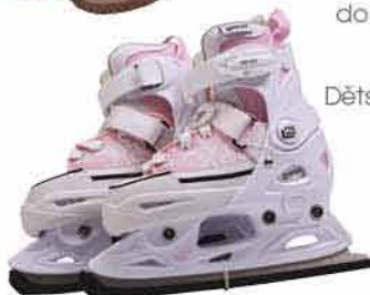
Dětské roztažovací brusle TEMPISH 1 199,-