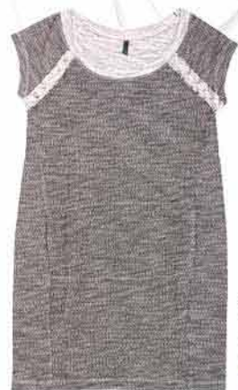
Dámské šaty UNITED COLORS OF BENETTON 1 349,-