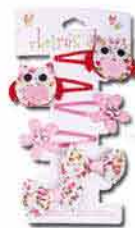
Dívčí sponky CLAIRE'S 169,-