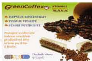
GreenCoffex 10 tob. Doplněk stravy Přírodní (nesyntetický) kofein získaný přímo ze zrněk pravé kolumbijské zelené kávy. RENT-PHARM 100,-