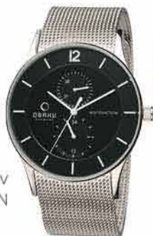
Pánské hodinky OBAKU PRÉSENCE 3 990,-