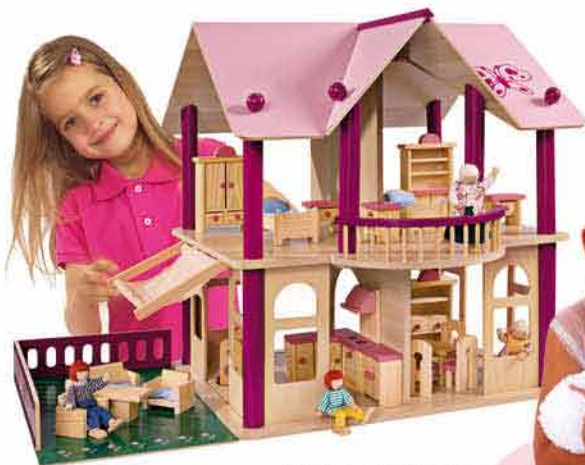
Dřevěná vila s nábytkem POMPO 2 199,- 1 599,-