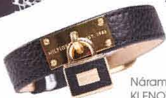
Náramek Tommy Hilffiger KLENOTY AURUM 2 250,-