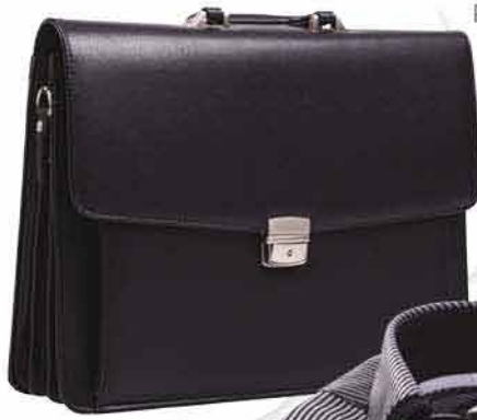
Pánská aktovka LARA BAGS 990,-