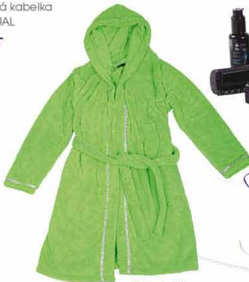
Dámský župan SOFT WORLD 850,-