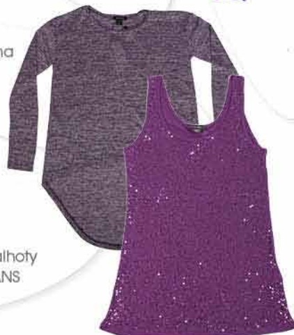
Dámský top NEW YORKER 349,-