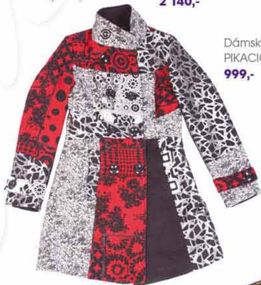
Dámský kabát PIKACIO 999,-