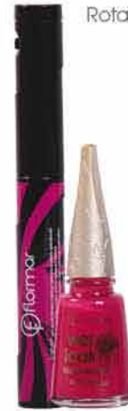
Rotační řasenka FLORMAR 295,- 236,-