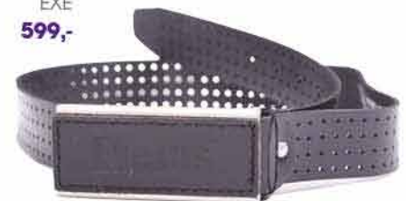
Pánský pásek EXE 599,-