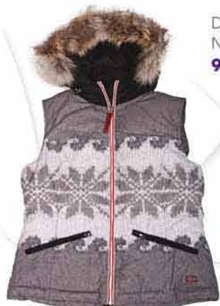
Dámská vesta NAPAPIJRI 9 100,-