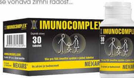
Imunocomplex 30 tob. Doplněk stravy Imunocomplex obsahuje potřebné látky pro Váš imunitní systém. RENT-PHARM 199,-