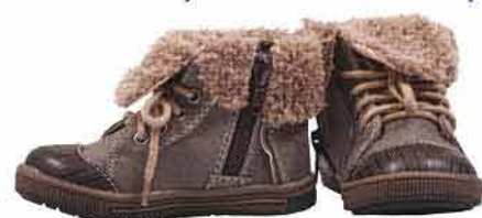
Chlapecká obuv BAŤA 599,-