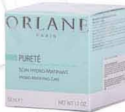
Hydratační a zmatňující péče ORLANE MARIONNAUD 2 199,-