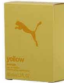
Puma Yellow woman EDT 40 ml TETA DROGERIE 549,90