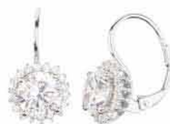
Stříbrné náušnice PRÉSENCE 1 690,-