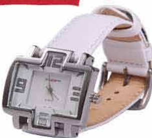
Dámské hodinky TOP TIME 980,- 490,-