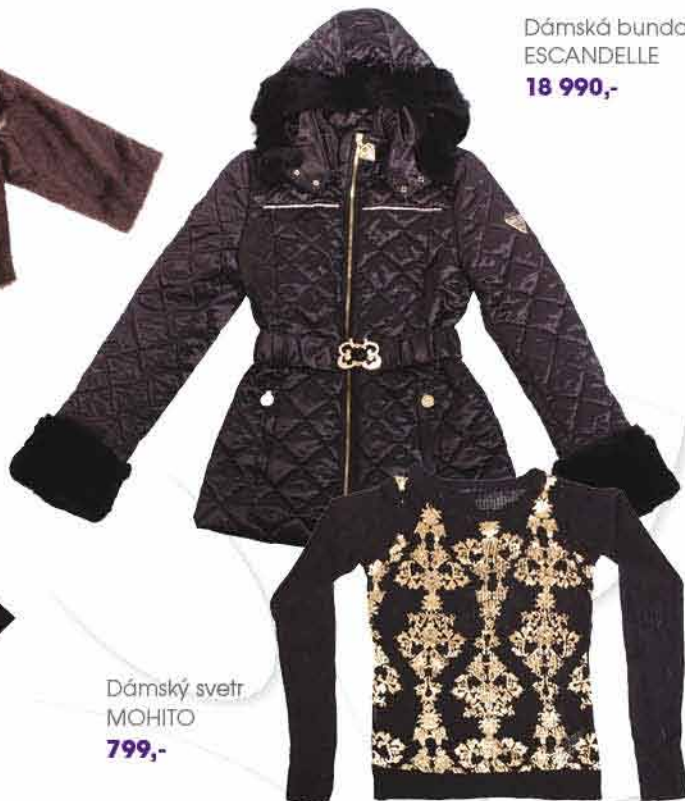
Dámský svetr MOHITO 799,-