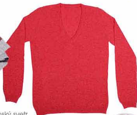
Dámský svetr UNITED COLORS OF BENETTON 999,-