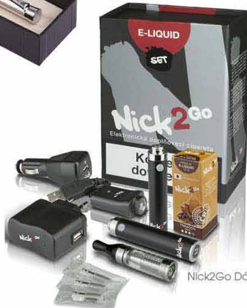
Nick2Go Dárkový set GECO 1-390,- 999,-