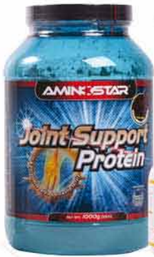
Joint Support čokoláda VITALAND 867,-