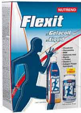
Balíček Flexit NUTREND 435,-