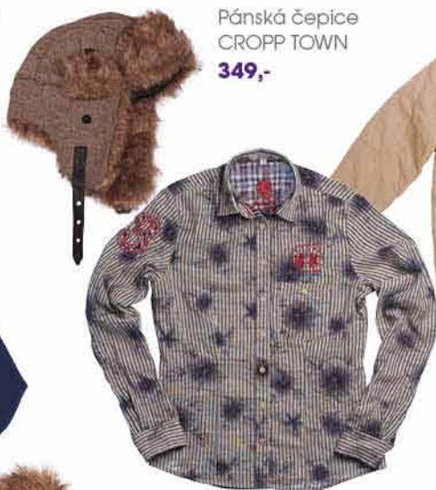
Pánská čepice CROPP TOWN 349,-