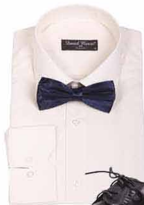
Pánská košile FANTAZIM 590,-