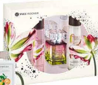
Dárková kazeta YVES ROCHER 799,-