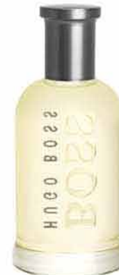
HUGO BOSS No. 6 EDT 30 ml FANN PARFUMERIE +210,- 690,-

Kvalitní krém nebo parfém jsou stálceři pod vánočním stromkem. Kosmetikou nikdy nic nezkažíte. Sportovce podpořte, aby byli fit a ve formě, a obdarujte je doplňky stravy.