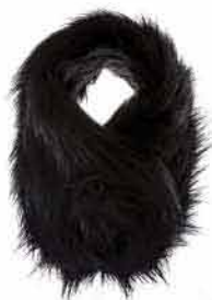
Kožeštinová šála FLOW SHORT RELAX 549,-