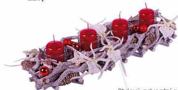
Stylový adventní svícen DARKA 559,-