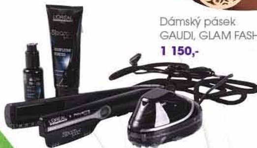
Parní žehlička na vlasy Steampod Kadeřnictví KLIER 4 990,-