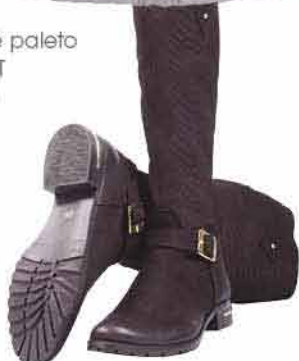
Dámská obuv DANEA 2 399,-