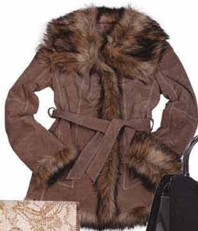
Dámský kabát EVOCO 4 800,-