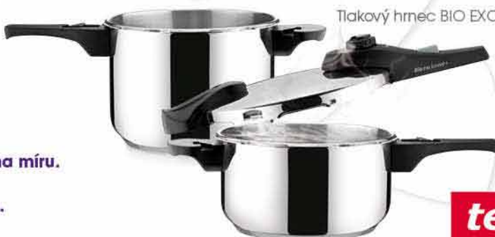
Tlakový hrnc BIO EXCLUSIVE + Duo 4,0 a 6,0 l TESCOMA 2 999,- 1 999,-

Nevíte co dětem, kamarádce nebo dědečkovi? V Galerii Šantovka je spousta obchodů, kde najdete inspiraci k nákupu vánočních dárců. Pro ty nejmenší hračky, starší uvítají dobrý spánek, zkuste tedy netradiční dárek v podobě kvalitní matrace. Všechny věkové kategorie si rády hrají, zkuste společenskou hru. A aby to našim mazlíčkům nebylo líto, máme něco i pro ně.