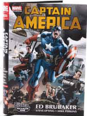
Kniha Captain America COMICSCITY 790,-

Elegantní muži, kteří mají rádi novinky v oblékání, budou nadšeni z košile s geniálním výřezem na hodinky. A ke košili darujte luxusní hodinky, protože doplňky potřebují i páni. Peněženky, pásy, šátky, stejně jako kvalitní pero nikdy nevyjdou z módy. Pro ty s duší kluka jsou ideální komiksy. Kuřáci ocení sadu s elektronickou cigaretou. V Galerii Šantovka jistě vyberete.