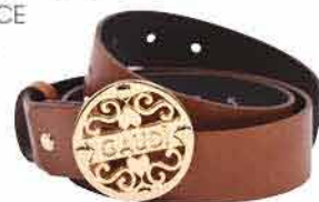
Dámský pásek GAUDI, GLAM FASHION STORE 1 150,-