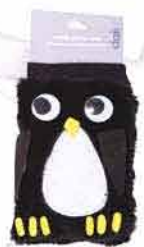
Obal na mobil CLAIRE'S 129,-