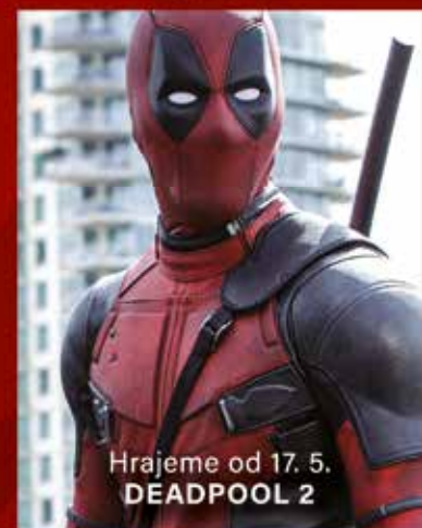
Hrajeme od 17. 5. DEADPOOL 2