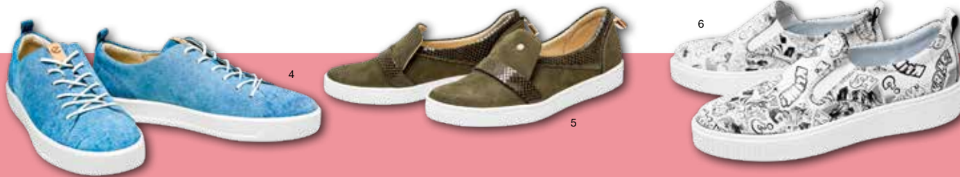
1. Sandály na podpatku, DEICHMANN, 699 Kč, 2. Lodičky, HUMANIC, info o ceně v prodejně, 3. Trekové boty, LOAP, 4090 Kč, 4. Tenisky, ECCO, 3499 Kč, 5. Celokožená dámská obuv ruční výroby, LE Shoes, 2 299 Kč (s kuponem 1 699 Kč), 6. Dámské kožené slip on, Baťa, 1 599 Kč