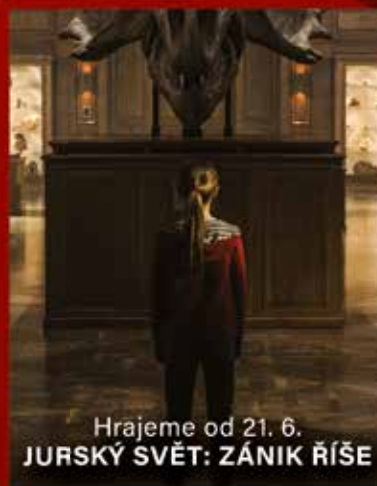
Hrajeme od 21. 6. JURSKÝ SVĚT: ZÁNIK ŘÍŠE