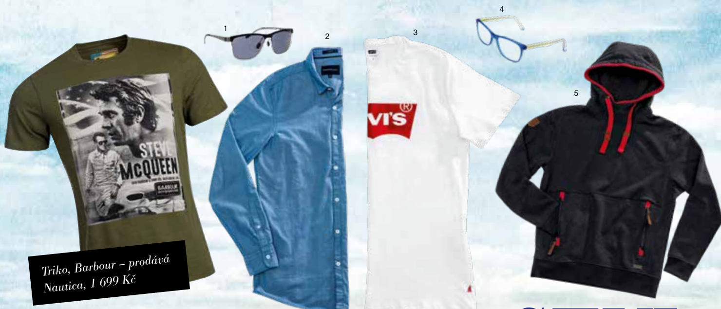
Triko, Barbour – prodává Nautica, 1 699 Kč