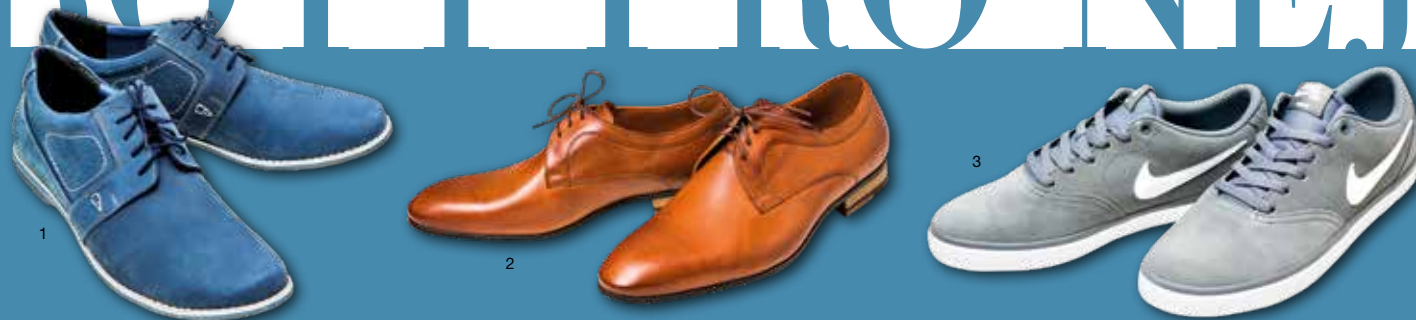
1. Polobotky, LE Shoes, 2300 Kč, 2. Polobotky, Reno obuv, 1899 Kč, 3. Tenisky, DEICHMANN, 1 799 Kč