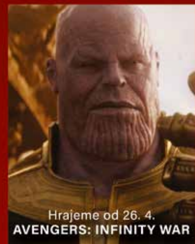
Hrajeme od 26. 4. AVENGERS: INFINITY WAR