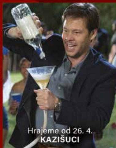
Hrajeme od 26. 4. KAZIŠUCI