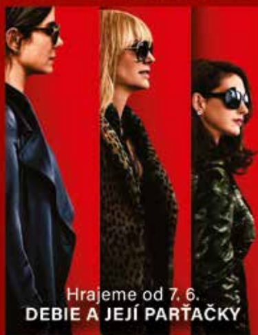
Hrajeme od 7. 6. DEBIE A JEJÍ PARTAČKY