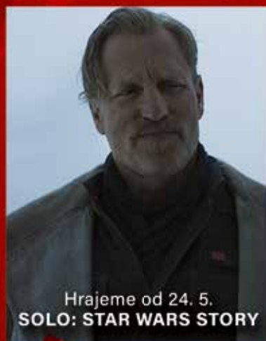
Hrajeme od 24. 5. SOLO: STAR WARS STORY