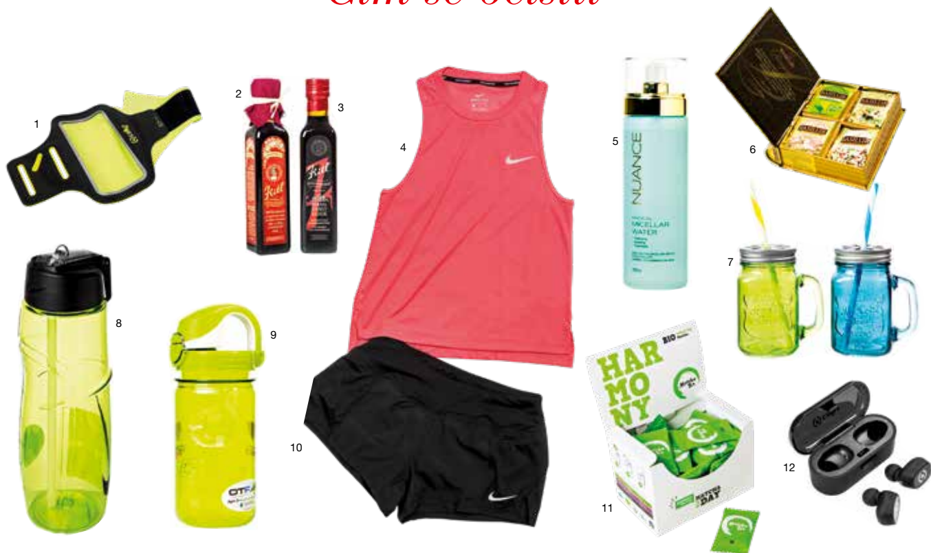
1. Sportovní pouzdro na telefon, F-mobil, 499 Kč, 2. Životabudič Kittl muži – doplněk stravy, Albi, 139 Kč, 3. Životabudič Kittl ženy – doplněk stravy, Albi, 129 Kč, 4. Funkční tílko, A3 SPORT, 640 Kč, 5. Micelární voda, Lékárna Dr. Max, 299 Kč, 6. Zelené čaje, INDECOR, 299 Kč, 7. Sklenice s brčkem, INDECOR, 69 Kč, 8. Lahev na pití Nike, INTERSPORT, 699 Kč, 9. Lahev na pití, LOAP, 449 Kč, 10. Funkční kraťasy, A3 SPORT, 870 Kč, 11. Matcha Tea, Albi, 399 Kč, 12. Bezdrátová sluchátka, F-mobil, 1 699 Kč