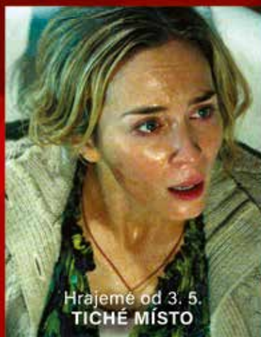
Hrajeme od 3. 5. TICHÉ MÍSTO