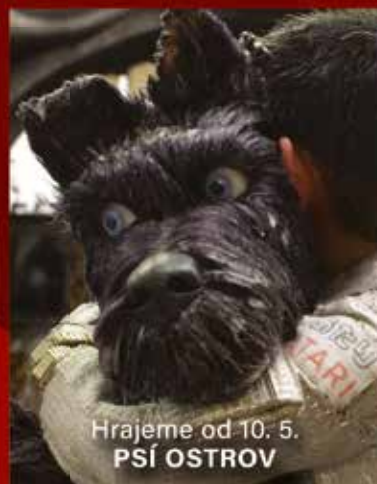
Hrajeme od 10. 5. PSÍ OSTROV