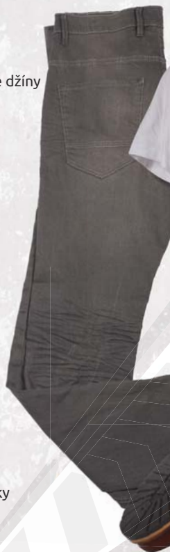
▶ Pánské džíny C&A 698,-

Šedá je neutrální a stále oblíbená. V zimě k ní můžete sladit celý šatník. Dámy ji mohou doplnit růžovými tóny a pánové červenou či tmavě modrou. A že květiny patří jaru? Letošní rok můžete v květinovém vzoru prochodit celý.