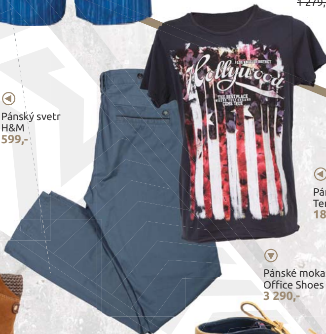
▼ Pánské tričko Terranova 189,-