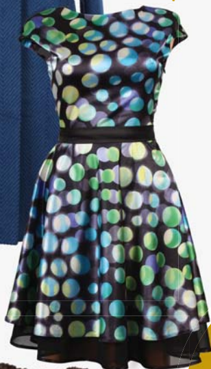
▼ Dámské šaty Bonesprit 3 590,-