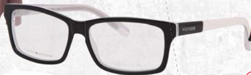
▼ Dámské brýle Grand Optical 4 700,-