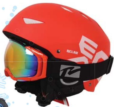
▶ Helma Relax 1 299,-