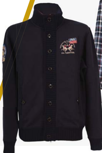
◀ Pánská mikina La Martina 7 199,-