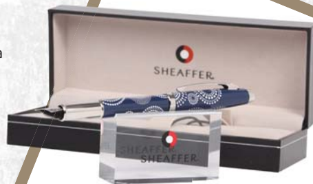
▼ Plnicí pero Papírnictví + 1 225,-