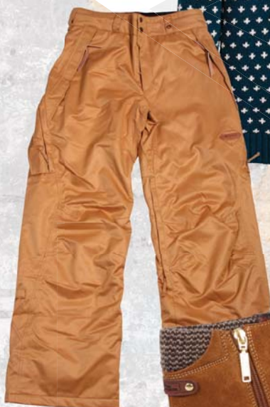
▼ Pánské kalhoty Nugget Store 4 390,-