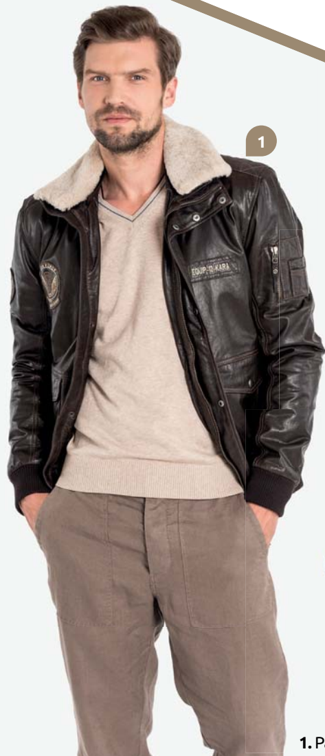
1. Pánská bunda (KARA) 6 999,-