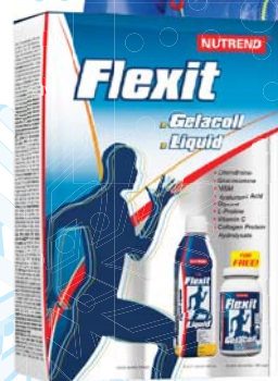
▶ Flexit Liquid + Gelacoll Nutrend 435,-