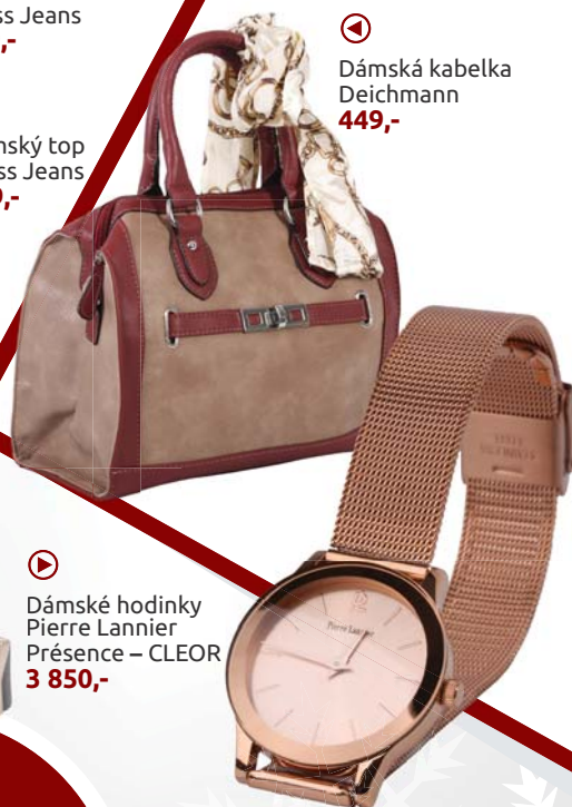
◀ Dámská kabelka Deichmann 449,-