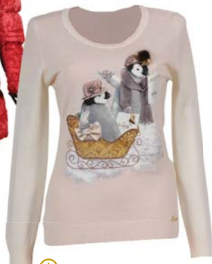
▶ Dámský svetřík originál Swarovski kameny Escandelle 8 490,-