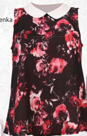
▶ Dámská halenka Tally Weijl 529,-