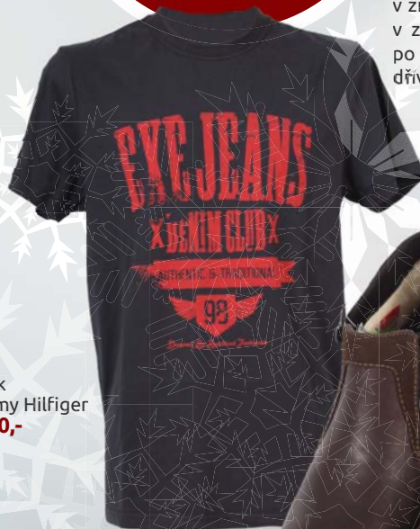
◀ Pánské triko Exe Jeans 449,-