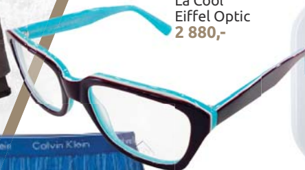
▼ Brýle unisex La Cool Eiffel Optic 2 880,-