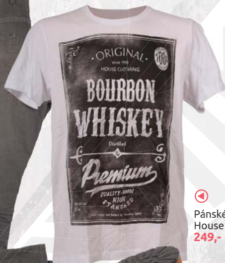
▶ Pánské triko House 249,-