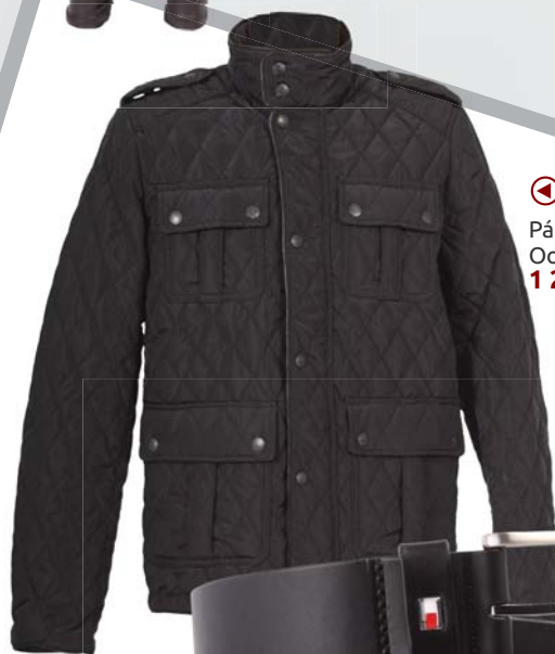
◀ Pánská bunda Oodji 1 249,-

V zimě hlavně pohodlí a teplo. Péřové bundy a džíny ve všech podobách, to vám nesmí v zimním outfitu chybět. Procházka v zimním parku po práci nebo po škole přijde vhod mladým i těm dříve narozeným.