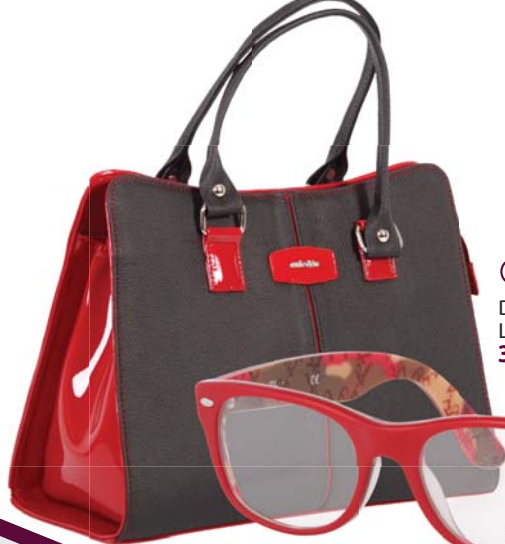
☐ Dámská kabelka Lara Bags 3 375,-