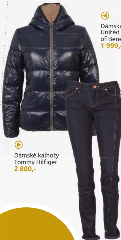
◀ Dámská bunda United Colors of Benetton 1 999,-