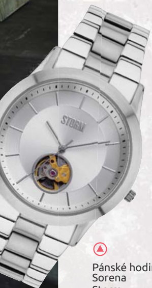
▶ Pánské hodinky Sorena Storm 12 550,-