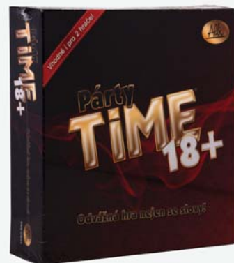
▲ Párty time Albi 549,-