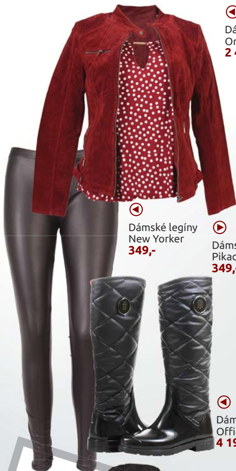
◀ Dámská bunda Orsay 2 499,-