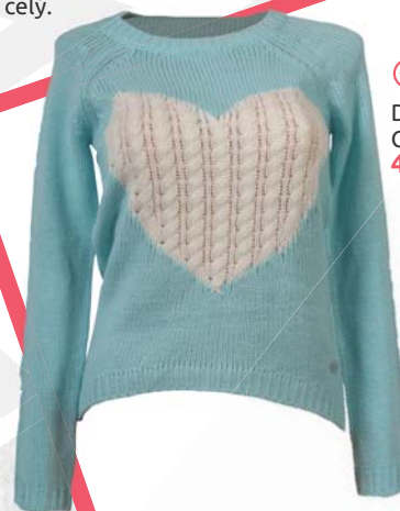
▶ Dámský svetřík Cropp 499,-