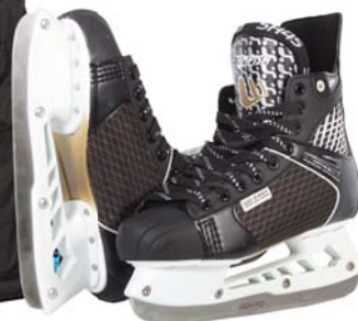
▶ Pánské brusle Tempish 1 990,-