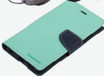
▶ Obal GT Mobil 399,-