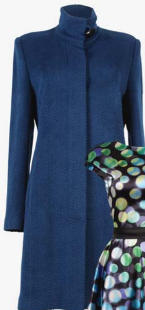
◀ Dámský kabát BHR Fashion 5 900,-