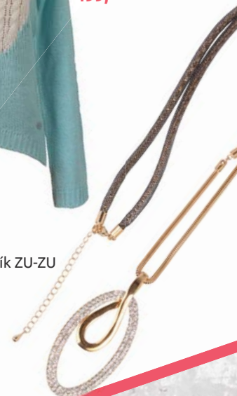
▶ Náhrdelník ZU-ZU Top Time 590,-