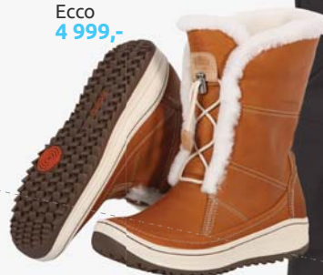
▶ Dámská obuv Ecco 4 999,-