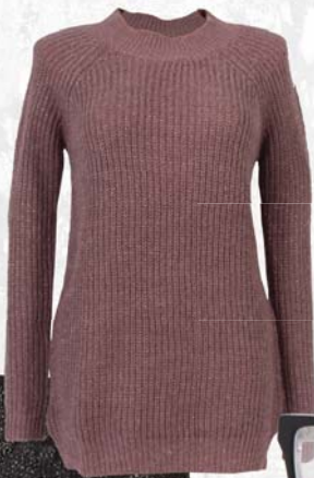
◀ Dámský svetřík Promod 949,-