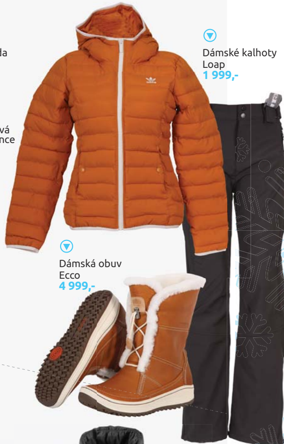
▶ Dámské kalhoty Loap 1 999,-