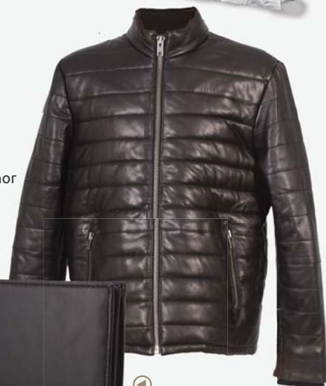
▶ Peněženka Tommy Hilfiger 1 820,-