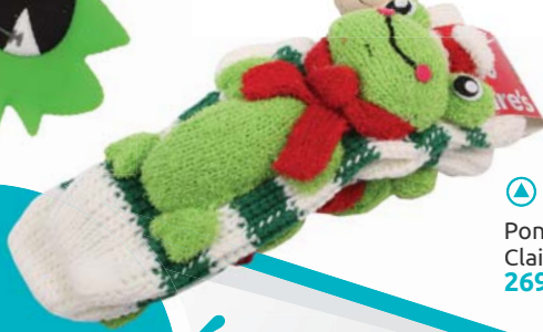
▶ Ponožky Claire's 269,-