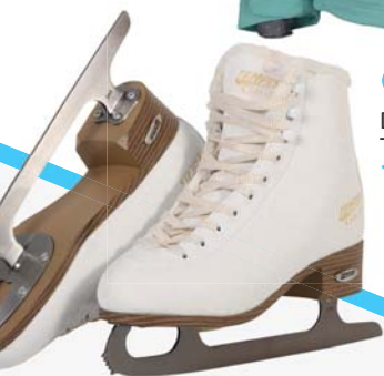
▶ Dámské brusle Tempish 1 490,-