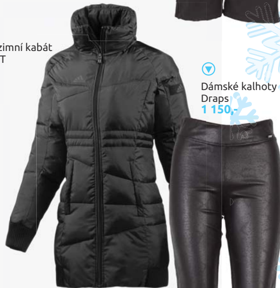
▶ Dámské kalhoty Draps 1 150,-