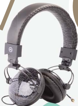
▶ Sluchátka House 549,-