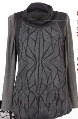
◀ Dámské triko Cross Jeans 749,-