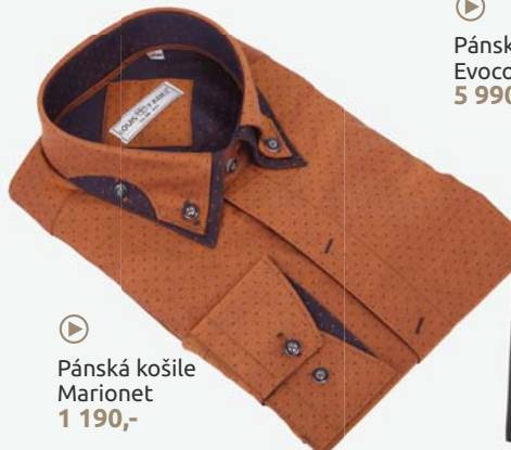
▶ Pánská košile Marionet 1 190,-