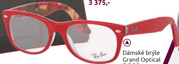
☐ Dámské brýle Grand Optical 5 300,-