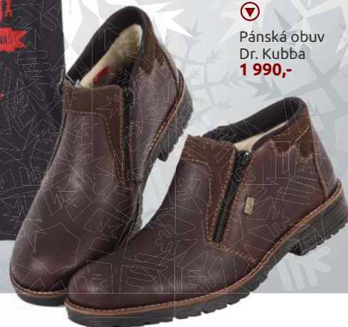
▼ Pánská obuv Dr. Kubba 1 990,-