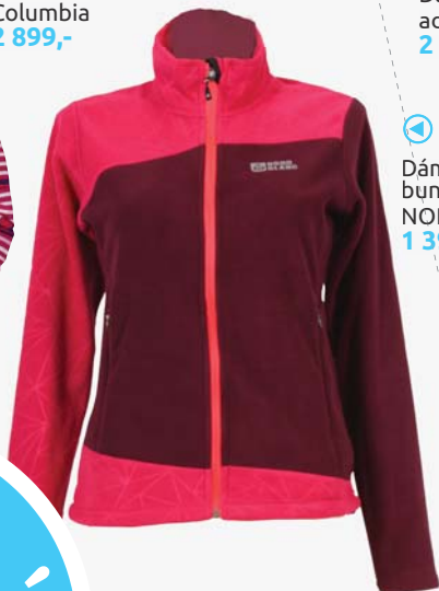
◀ Dámská fleecová bunda Turbulence NORDBLANC 1 395,-