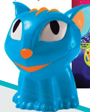
▶ Interaktivní hračka JINN uhádne, co si myslíš Pompo 699,-