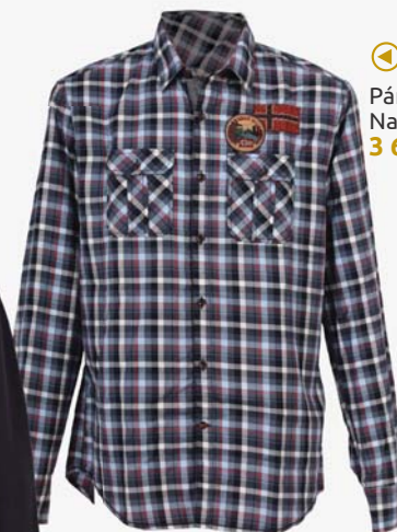
◀ Pánská košile Napapijri 3 650,-