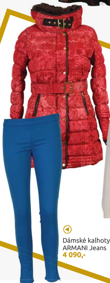
◀ Dámský kabát Desigual 5 090,-

Zima se kvapem blíží a mraz už kreslí na okna. A jak si lépe užít zimu, než v pořádně teplém kabátu nebo bundě. Navštivte prodejny v Galerii Šantovka a oblečte se do vašich oblíbených značek. Nové zimní kolekce už čekají!