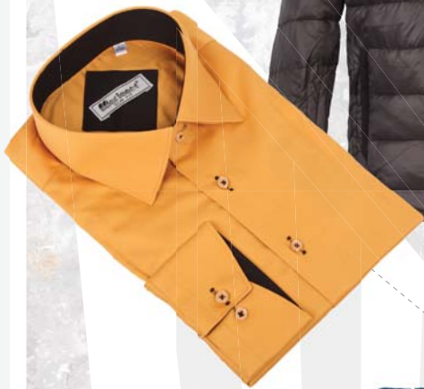
▼ Pánská košile Marionet 1 190,-