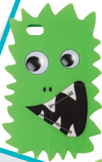
◀ Obal na mobil Claire's 269,-