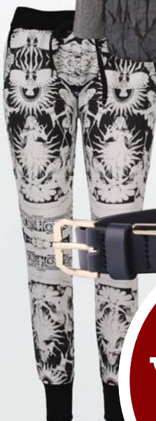
▼ Dámský pásek Tommy Hilfiger 2 240,-