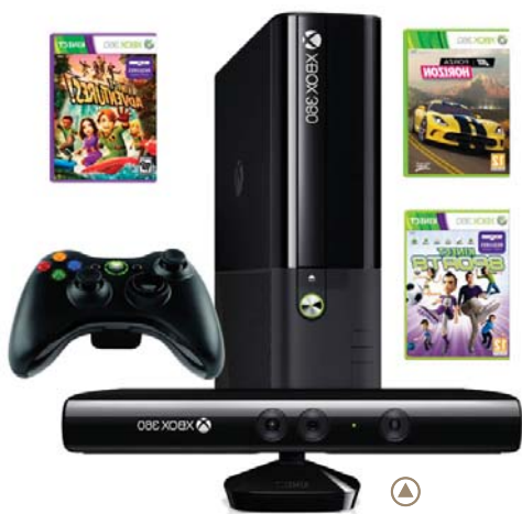
▲ Herní konzole Microsoft Xbox 360 4GB + Kinect senzor + 3 hry zdarma Euronics 5 999,-