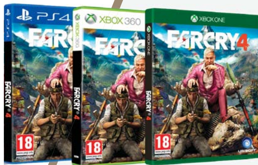
▲ Far Cry 4 Hráč od 1 299,-