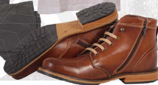
▶ Pánská obuv Deichmann 1 399,-