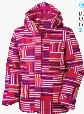
◀ Dětská lyžařská bunda COLUMBIA NORDIC JUMP Columbia 2 899,-