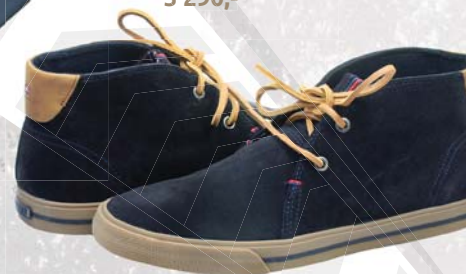
▼ Pánské mokasiny Office Shoes 3 290,-