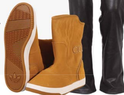
▶ Dámská obuv adidas 2 399,-